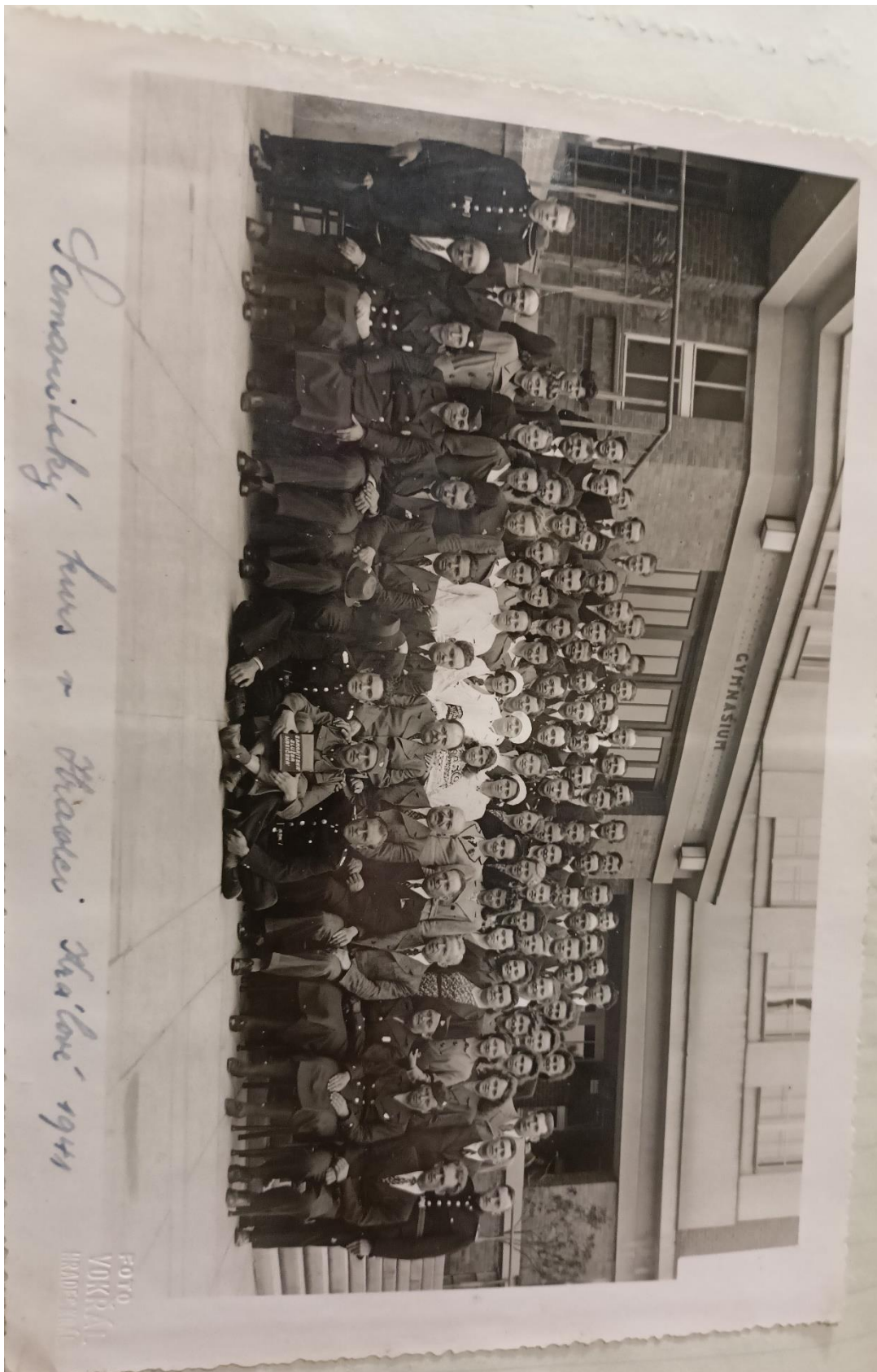
Samaritský kurz v Hradci Králové 1941.